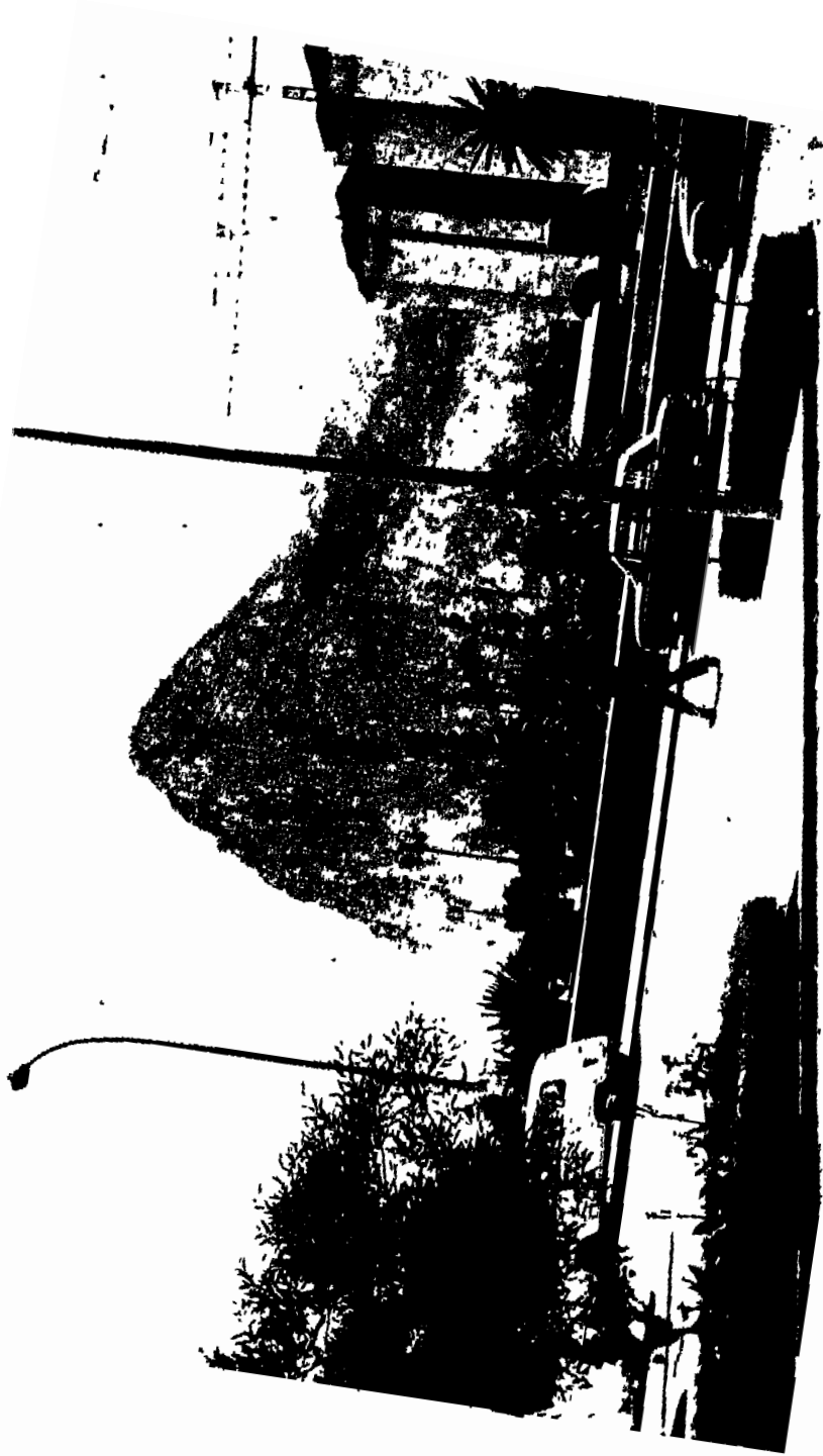
جبل طارق كما يبدو من مدينة الجزيرة الخضراء